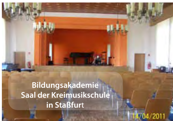
Bildungsakademie Saal der Kreismusikschule in Staßfurt

Teile der Dachsanierung, Brandschutzertüchtigung im Dachgeschossbereich und Holzschutzmaßnahmen. Noch nicht erfolgt ist der Austausch der Fenster im Treppenhausbereich.