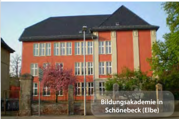
Bildungsakademie in Schönebeck (Elbe)

Teile der Dachsanierung, Brandschutzertüchtigung im Dachgeschossbereich und Holzschutzmaßnahmen. Noch nicht erfolgt ist der Austausch der Fenster im Treppenhausbereich.